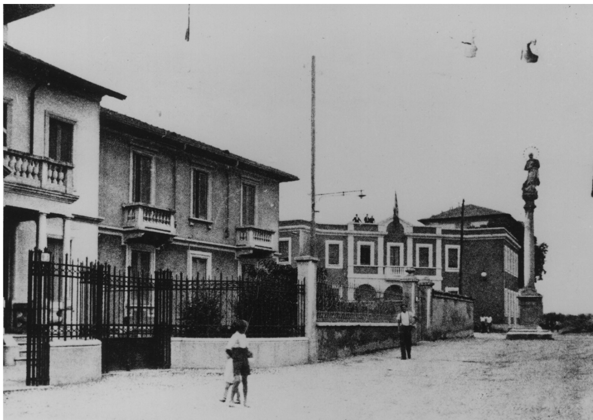
La statua della Madonna Immacolata nella sua originaria collocazione

Nell'anno 2000 viene istituita la Benemerenzza Civica "Castela d'Oro", rendendo omaggio alla statua della Madonna Immacolata considerata dai cittadini bressesi il "monumento di Bresso" e detta, appunto, Castela.