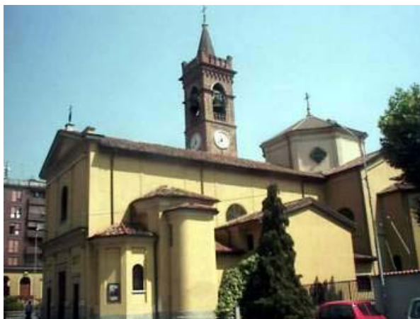
La Chiesa dei SS. Nazaro e Celso

La Chiesa dei Santi Nazaro e Celso non doveva essere molto diversa dall'edificio descritto dal delegato arcivescovile Francesco Cermenati nel 1567: a navata unica, privo di cappelle, con la facciata a capanna, in mattoni a vista, affiancata dal campanile, dall'ossario e dalla casa parrocchiale. Il campanile subisce un crollo e viene distrutto alla fine del cinquecento. Viene ricostruito nel 1611 e ulteriormente modificato in epoca recente.