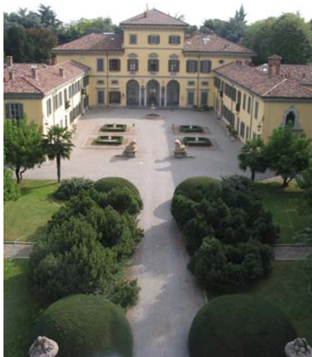
Villa Rivolta (già Villa Patellani)