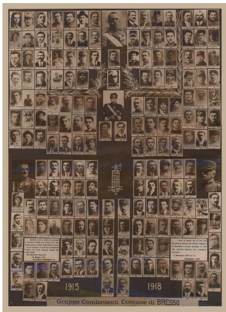
Composizione fotografica dei combattenti bressesi della Prima Guerra Mondiale

Il 24 Maggio 1915 l'Italia entra in guerra contro Austria e Germania e seicento bressesi vi prendono parte: dalla classe 1874 a quella 1900.