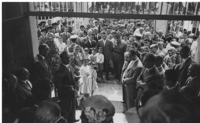
Inaugurazione della scuola di via Lurani

Nel 1977 Bresso raggiunge il numero di 34.590 abitanti, pari a 10.173 abitanti per Km 2 : la più alta densità abitativa d'Italia.