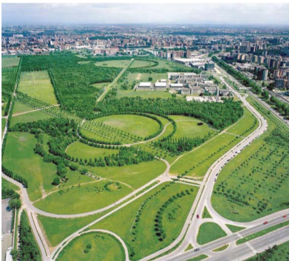
Veduta aerea del Parco Nord

Chiudono in questi anni la Isorivolta, la Pernotti, la Retam, la Tramontana, la GBF, l'Officina Alfieri, il maglificio La Magna.