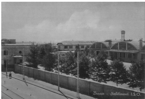
Lo stabilimento della ISO

I capannoni ancora visibili dalla via Vittorio Veneto ricordano questa epoca in cui Bresso, nel suo piccolo, diede un significativo contributo all'innovazione tecnologica, alla storia del design e allo sviluppo dell'economia dell'hinterland.