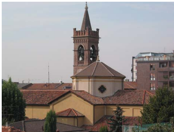
La Chiesa dei SS. Nazaro e Celso

In una relazione del maggio 1688, in occasione della visita pastorale del cardinal Visconti si scrive che “la chiesa assai capace ed elegante è dedicata ai SS. Martiri Nazaro e Celso e misura 36 cubiti di lunghezza (15 metri) e 26 di larghezza (10 metri circa). La nave della chiesa è coperta da un tavolato, il coro da una volta. Contiene due altari: il maggiore nel cui tabernacolo di legno dorato ed ornato di piccole colonne si conserva il SS. Sacramento; l'altro invece è dedicato alla Madonna e situato dal lato del Vangelo” .