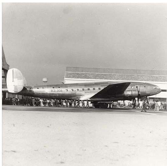
Aeroporto di Bresso: quadrimotore BZ 308

Bresso subisce un primo bombardamento all'inizio della primavera del 1944. Il 30 Aprile 1944 apparecchi americani sganciano bombe sullo stabilimento Breda-Campovolo e tutti i capannoni vengono rasi al suolo.